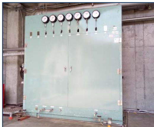
ガス供給ユニット