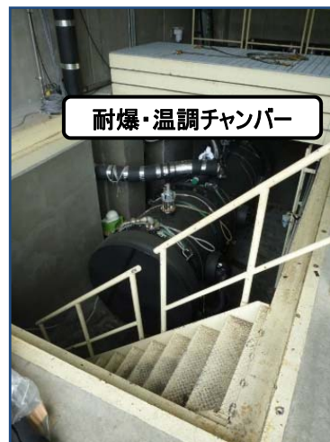
地下ピット(試験時)