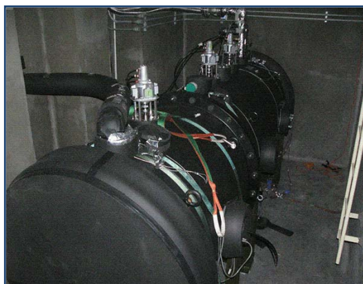
耐爆・温調チャンバー