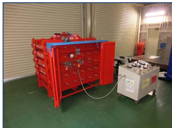
ガスブースター装置