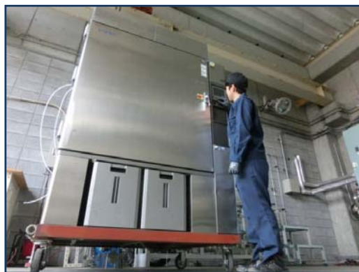
部品試験用大型恒温槽(恒湿槽)