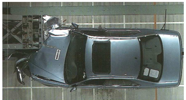
デフォーマルバリアへの 前面オフセット衝突試験