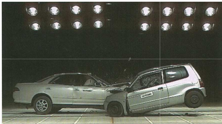
車対車オフセット 前面衝突速度